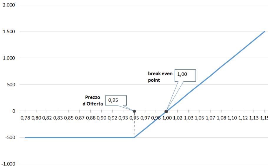
DIRITTI DI OPZIONE Destination Italia S.p.A.

Il presente grafico di payoff mostra il profitto (o la perdita) per detentore dei Diritti di Opzione durante il Periodo di Offerta (dal 6 novembre al 23 novembre 2023 compresi). Il Prezzo di Offerta è pari ad euro 0,95. L'investimento iniziale consente di acquistare n. 50.000 Diritti di Opzione, e prevede un esborso pari ad euro 500,00 per l'acquisto dei Diritti e pari ad euro 9.500,00 per la sottoscrizione di n. 10.000 azioni ordinarie di nuova emissione.